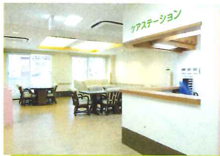
入居者の皆様でお過ごしいただく食堂・談話室